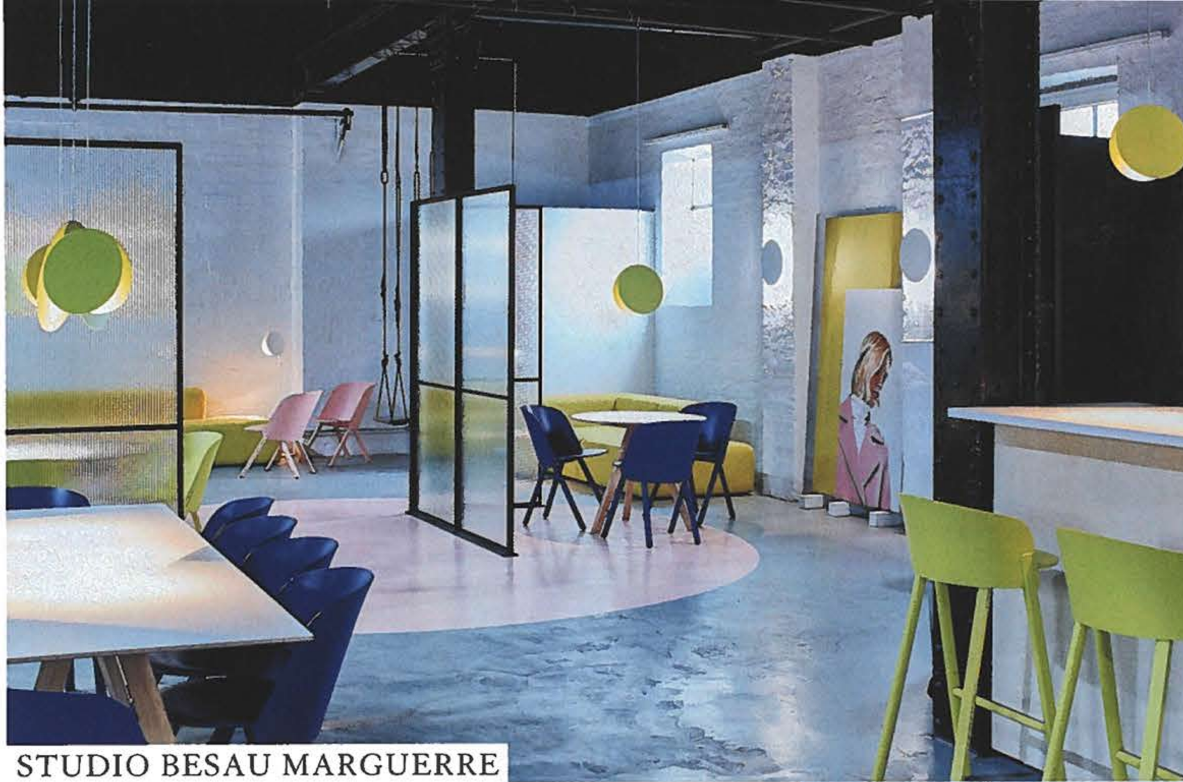
STUDIO BESAU MARGUERRE

Das Hamburger Studio hat für den Retail-Store «About You» ein offenes Interior mit prägnanten Farbkonzepten gestaltet.